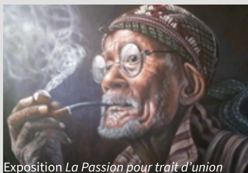
Exposition La Passion pour trait d'union

M. Cassan, photos - Vernissage le 6 mars à 18h30